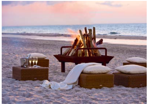
Photographie Photos de presse Strandhotel Dünenmeer