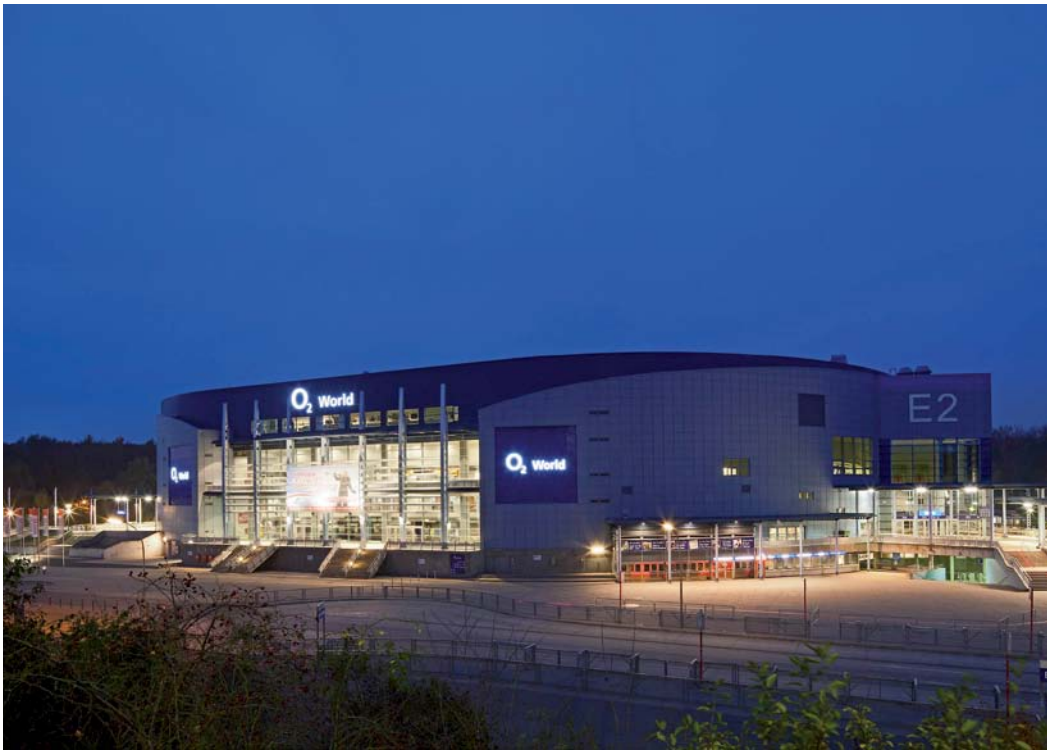
O 2 World Hamburg