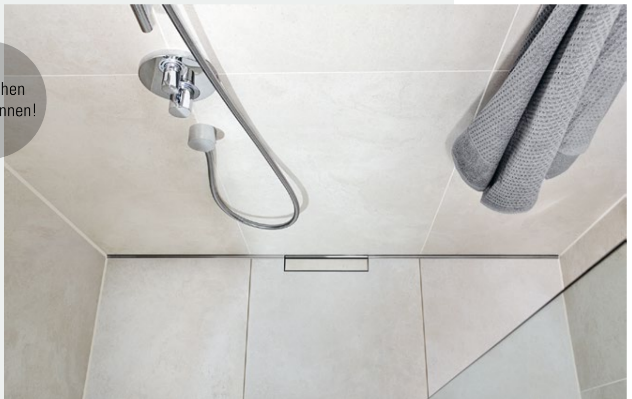
Referenzshooting 2015, Einbau der Duschrinne CeraWall P, Grand Elysee Hotel, Hamburg

Die Teilnahme an der Aktion ist denkbar einfach und schnell. So wird's gemacht: