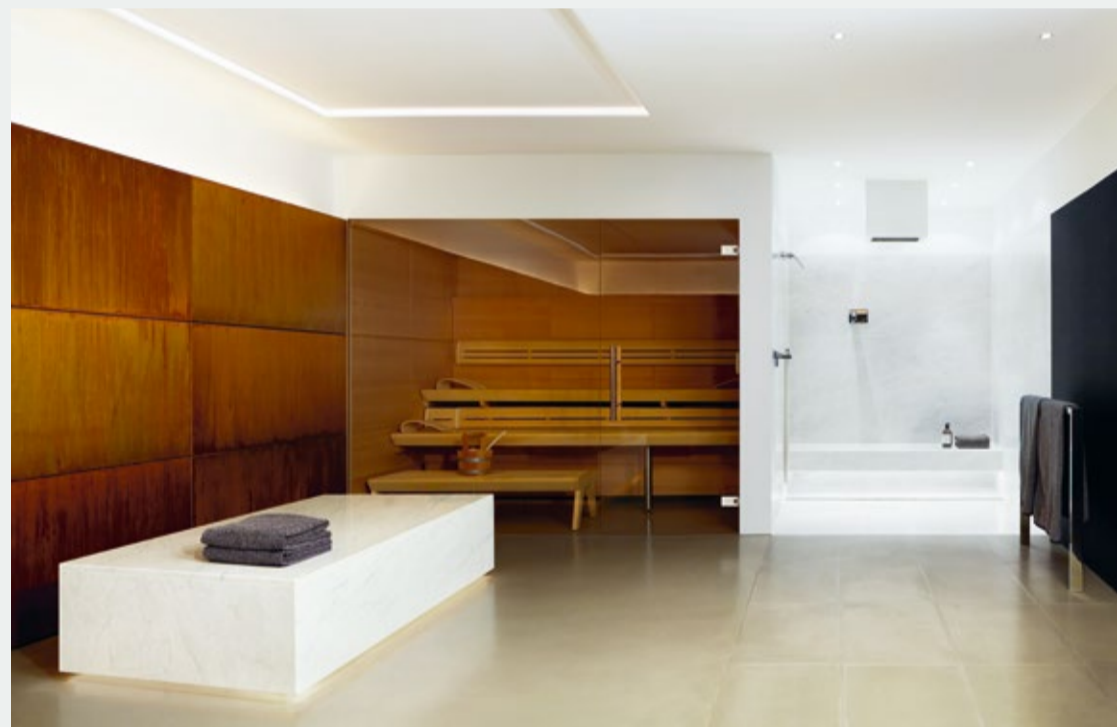
Referenzshooting 2015, Einbau der Duschrinne CeraFloor S

Sie haben eine Dallmer-Duschrinne montiert? Nutzen Sie die Chance auf designstarke Bilder Ihrer Top-Referenz!